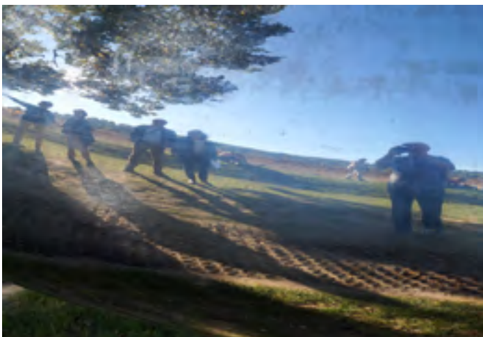
Pour une fois, le photographe avait envie d'être sur la photo sans "SEL phi", mais au prix d'une belle déformation...