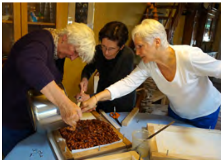
Une entraide nécessaire, pour le nougat...