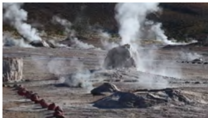
Pas gênés par l'altitude !

Puis nous sommes arrivés dans le désert d'Atacama, la région du monde la moins arrosée. Des paysages extraordinaires, des déserts de sel, beaucoup de flamands roses et d'autres oiseaux et des geysers presque aussi spectaculaires qu'à Yellowstone. Ils sont situés à 4300 m d'altitude et pour y arriver, nous avons passé un col à 4600 m.