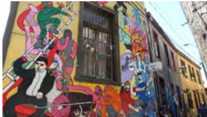
une rue de Valparaiso

Valparaiso est très colorée ce qui explique qu'elle est classée au patrimoine de l'Unesco