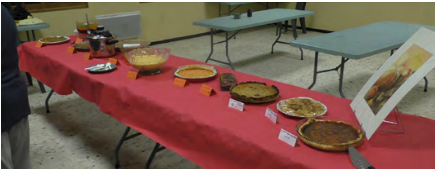
Des recettes qui nous rappellent notre "Défi de la courge" (IntraSEL Novembre 2015)

PS : On peut donc remplacer la courge, le potimarron ou le potiron par des carottes.