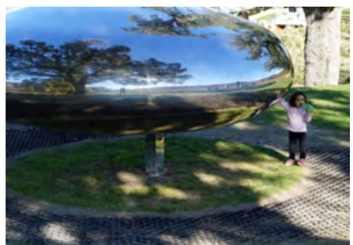
due à "la goutte"