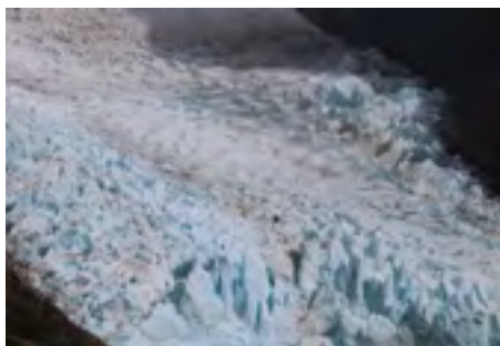
le glacier Serrano

Cette région du monde, froide, accablée par des vents puissants, inculte vit arriver des aventuriers et ou des pionniers qui réussirent à faire fortune à force de persévérance et d'intelligence. A Punta Arena nous avons pu voir de magnifiques demeures meublées avec tout ce que le début du 20ème siècle offrait. Des paysages extraordinaires, des glaciers, des lacs donc de très nombreuses photos.