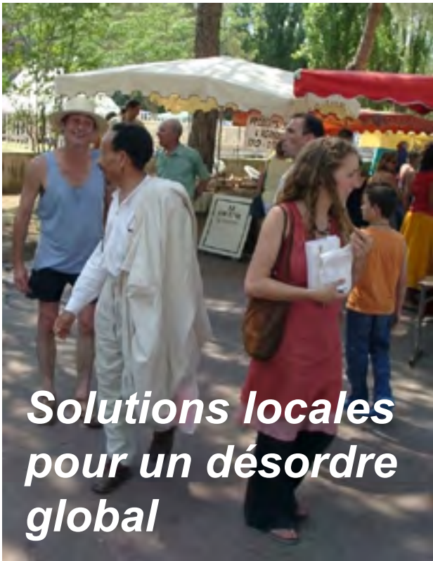
Pierre Rabhi à la Foire "bio" de La Roque d'Antheron - Juin 2008

Ne pouvant produire sans épuiser, détruire et polluer, le modèle dominant de notre société contient les germes de sa propre destruction et nécessite d'urgence des alternatives fondées sur la dynamique du Vivant.