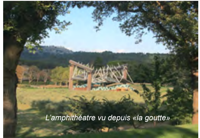
L'amphithéâtre vu depuis «la goutte»

Un temps superbe, une magnifique promenade. Esprits un peu rebelles nous avons fait la balade dans le sens contraire des promeneurs, Liliane aux commandes de la carte et Françoise des explications.